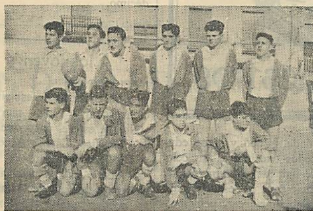
El Juvenil Lasalle, que tan buen papel ha hecho en la actual temporada

su oficina, rectora de estos campeonatos, en los propios locales de la C. N. S., bajo el control de un solvente Comité de Competición que confeccionaba los calendarios, designaba los árbitros para los encuentros, aplicaba sanciones, atendía debidamente, tanto en el aspecto sanitario como en el económico, a los jugadores lesionados y concedía premios, consistentes en prendas y enseres propios del juego y en algunas