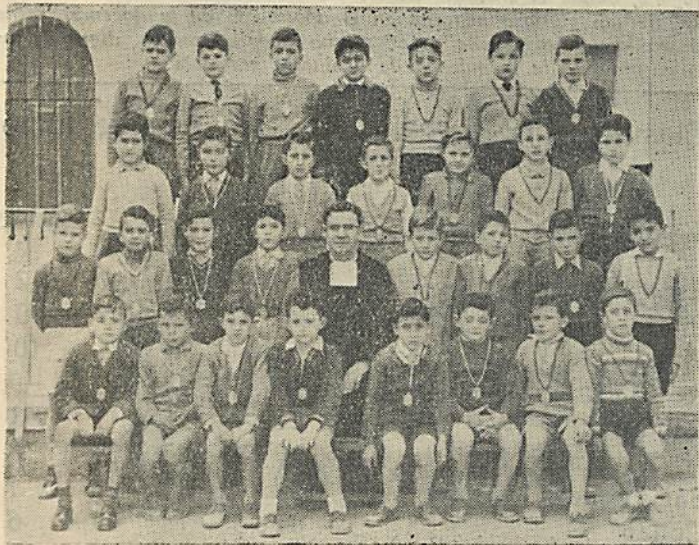
He aquí este simpático y selecto grupo de Congregantes del Santísimo Niño Jesús, que por su piedad y comportamiento ejercen benéfica influencia entre sus compañeros de clase

No desesperes por ello. No eres tú solo; también tus amigos anduvieron ese camino... y lo recuerdan con orgullo. Si lo tomas con resignación cristiana se te hará más llevadero el camino.